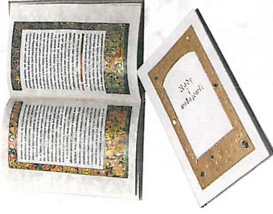
Św. Jan od Krzyża, Rady i wskazówki. Cena 8 000 zł. KURTTIAK I LEY