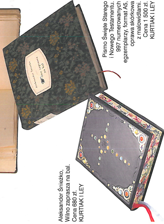
Pismo Święte Starego i Nowego Testamentu. 997 numerowanych egzemplarzy, format A5, oprawa skórkowa z malowidłami. Cena 1 500 zł. KURTTIAK I LEY